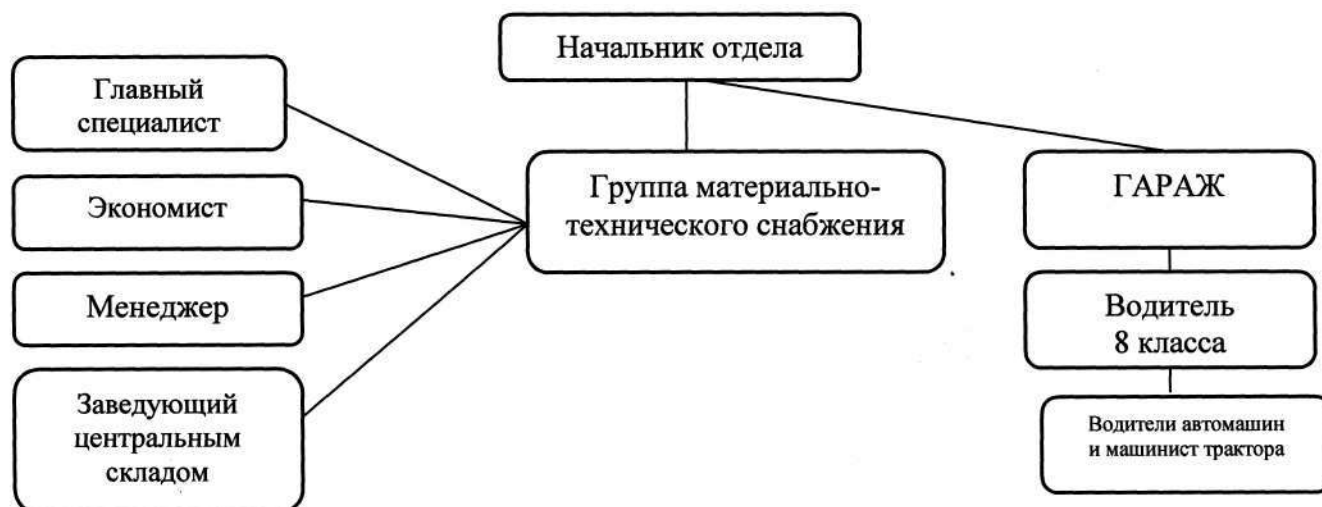
Рисунок 1 - организационная структура отдела.

Организационная структура отдела представлена на рисунке 1.